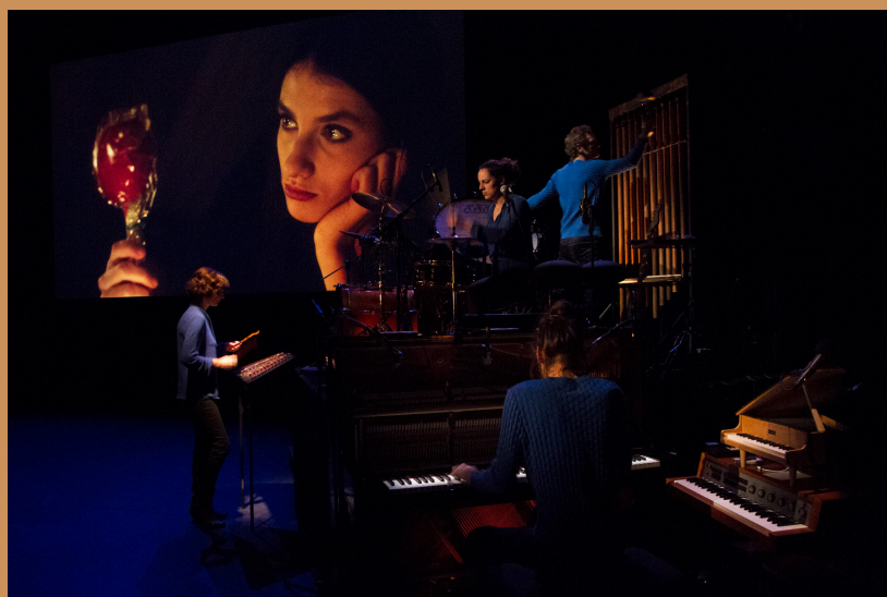
« Blanche-Neige ou la chute du Mur de Berlin » de la Cie Cordonnerie programmée au Phénix scène nationale Valenciennes. © Sébastien Dumas